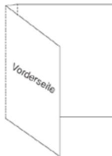
Abbildung 1 Abmessungen Einleger für DVD-Box (ohne Beschnitt)

Vor Produktionsbeginn prüfen wir Ihre PDF-Dateien. Sollten diese nicht den Anforderungen entsprechen, müssen die PDF-Dateien von Ihnen neu geliefert werden. Um einen reibungsfreien und termingerechten Ablauf zu gewährleisten, prüfen Sie deshalb bitte Ihre Daten hinsichtlich der oben beschriebenen Anforderungen.