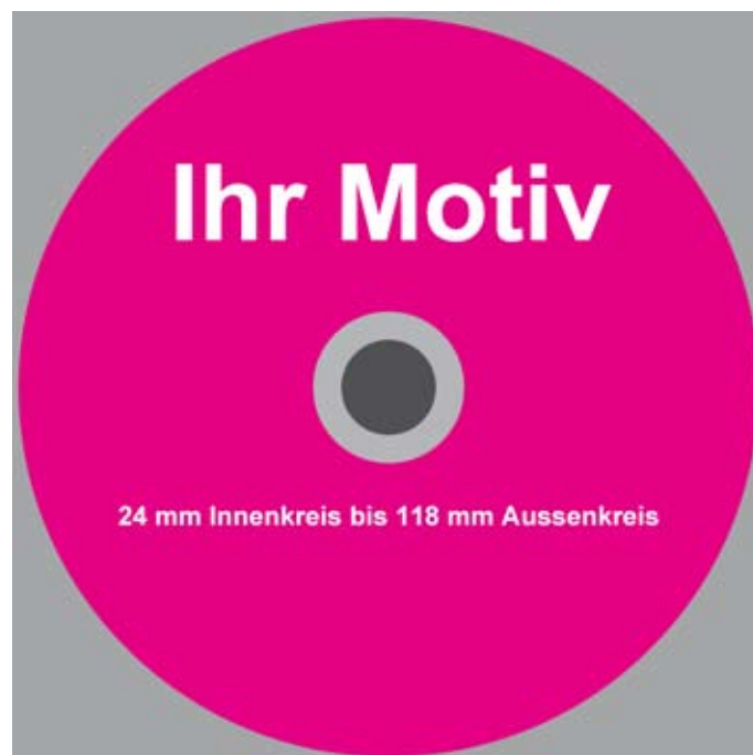
Abbildung 2 Sichtbarer bzw. druckbarer Bereich auf der CD-R/DVD-R