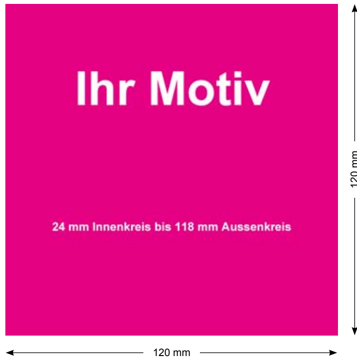
Abbildung 1 Motiv, angelegt mit 120 mm x 120 mm Kantenlänge